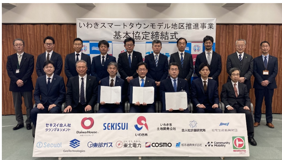
▲基本協定締結式の様子

今後もいわき市と連携し、参画企業・団体の総合力を結集することで、先駆的でサステナブルなまちづくりを目指して参ります。